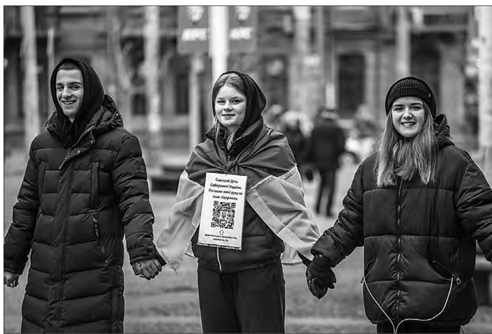
Акція з обіймами стала міжнародною.

«Хтось тисне руку. Інші підходять і обіймають. Одні дівчата навіть підсо-